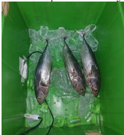
Gambar 6 Penempatan Sensor DS18B20 pada Media Ikan Tongkol untuk Validasi Akurasi

Akurasi sensor dihitung dengan membandingkan selisih pembacaan antara sensor pada prototipe ( T_{sensor} ) dengan termometer referensi ( T_{ref} ). Secara matematis, persentase kesalahan pembacaan sensor dapat dirumuskan sebagai berikut: