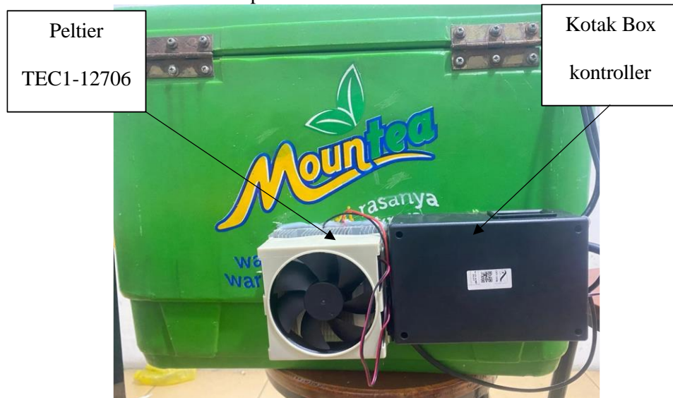
Gambar 4 Posisi Penempatan Peltier TEC1-12706 Dan Panel Box

Unit pendingin pada prototipe ini direalisasikan menggunakan teknologi termoelektrik yang bekerja dengan memindahkan panas secara aktif tanpa zat refrigeran. Implementasi ini difokuskan pada penciptaan kondisi bakteriostatik untuk menghambat pertumbuhan mikroorganisme pada ikan segar.