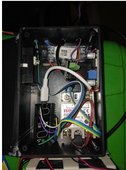
Gambar 1 Instalasi Mikrocontroller ke box panel

Pada bagian ini, dilakukan realisasi penyatuan antara mikrokontroler ESP32 sebagai unit pemroses pusat dengan berbagai sensor yang bertugas sebagai unit akuisisi data lingkungan. Proses integrasi ini memastikan bahwa data fisik dan kimiawi dari dalam coolstorage dapat ditangkap secara akurat sebelum ditransmisikan ke platform cloud.