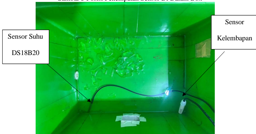
Gambar 3 Posisi Penempatan Sensor Di Dalam Box

Tahap pengujian dan kalibrasi dilakukan untuk memastikan bahwa data yang dikumpulkan oleh lapisan persepsi memiliki tingkat presisi yang tinggi sebelum digunakan untuk analisis kualitas ikan. Pengujian ini difokuskan pada validasi pembacaan sensor SHT30-D dan DS18B20 dengan membandingkannya terhadap alat ukur standar (termometer kalibrasi) guna menentukan persentase kesalahan (error) sistem.