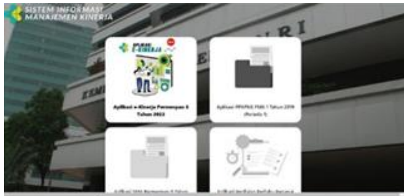
Gambar 1 Aplikasi e-Kinerja

Berdasarkan hasil penelitian kepada sekretaris Instalasi Radioterapi ia mengatakan bahwa, Sistem penilaian kinerja karyawan di Instalasi Radioterapi RSHS Bandung menggunakan aplikasi e-Kinerja Permenpan No 6 Tahun 2022, yang merupakan bagian dari Sistem Informasi Manajemen Rumah Sakit (SIMRS). Sistem ini dirancang untuk membantu manajemen mengevaluasi kinerja karyawan secara objektif dan terstruktur.