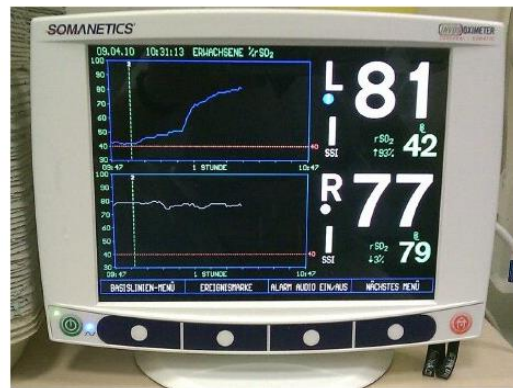
Gambar 1 Monitor NIRS (sumber: Bombor, Wissgott, & Andresen, 2015)

Penelitian terbaru menunjukkan bahwa data yang diperoleh dari NIRS dapat dikonversi menjadi data dalam bentuk lain untuk tujuan lebih banyak data klinis yang diperoleh dari pasien. NIRS dapat diekstraksi lagi datanya menjadi data HR, yang memiliki keunggulan dari metode tradisional seperti elektrokardiografi (EKG) dan photoplethysmography (PPG).